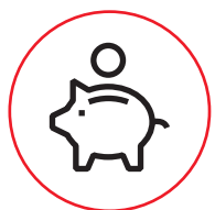
ABB Premi plus è l'operazione a incentivazione ABB che premia installatori e punti vendita dei distributori di materiali elettrico. Come? Più un installatore acquista, più viene premiato e più viene premiato il suo riferimento sul punto vendita! Più punti, più premi: partecipare è facilissimo: scopri come!